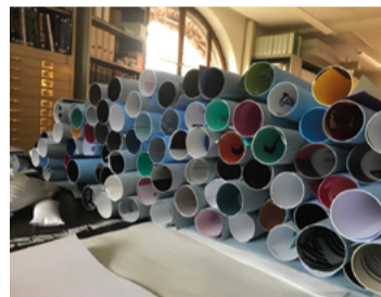
Bibliothèque de Genève, 2019

Collecter, organiser, gérer, conserver et mettre en valeur 130 000 affiches : un quotidien fait de contingences matérielles, de restauration, de dépoussiérage, mais aussi de recherches, de rencontres, de colloques et... de Jeudis midi !