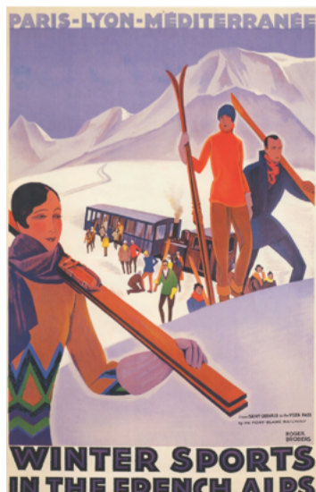
Roger Broders, vers 1929

Le réseau de chemins de fer Paris-Lyon-Méditerranée a édité de 1858 à 1937 environ 700 affiches formant un des plus beaux chapitres de l'affiche touristique mondiale avec des illustrateurs tels que Mucha, Cassandre, Chéret, Broders, Hugo d'Alési et d'autres. Grâce à elles, la Côte d'Azur, les Alpes, les grandes stations thermales... et Genève sont devenues célèbres.