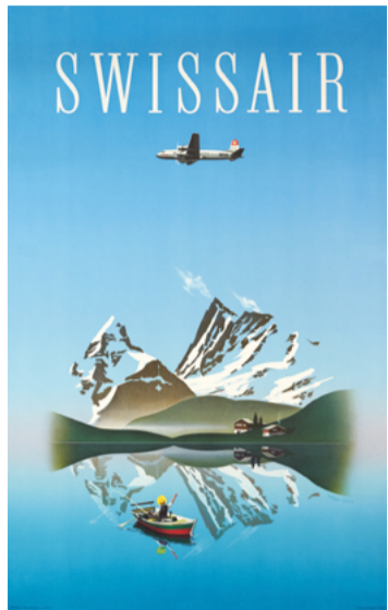
Herbert Leupin, 1949

Le célèbre logo Swissair de 1951, avec sa silhouette d'avion stylisée dans un globe, est un exemple mondialement connu du «Style Suisse International» encore enseigné dans les écoles de graphisme. Les nombreuses affiches Swissair diffusées à l'étranger vont devenir les ambassadrices de la qualité, de la rigueur et de la précision associées à la Suisse.