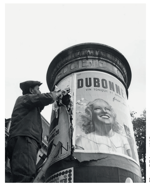
ca 1938