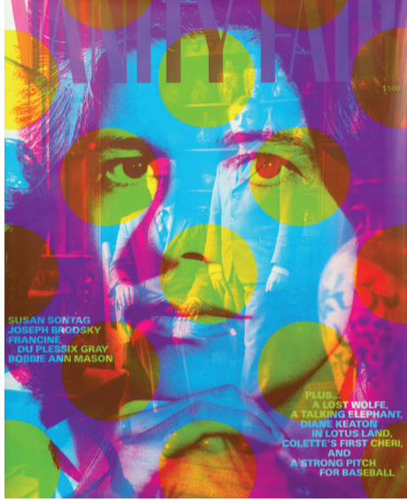
Gavillet & Cie, 2013

En 2012, l'agence a reçu le Grand Prix Suisse de Design pour sa contribution à la renommée du graphisme suisse, sur le plan national et international.