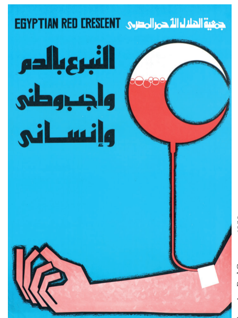
Egyptian Red Crescent, 1950

La collection d'affiches du Musée International de la Croix-Rouge et du Croissant-Rouge La collection d'environ 11000 affiches, provenant pour la plupart de sociétés nationales de la Croix-Rouge et du Croissant-Rouge, sera présentée au public à l'occasion d'une publication qui paraîtra fin mai 2019.