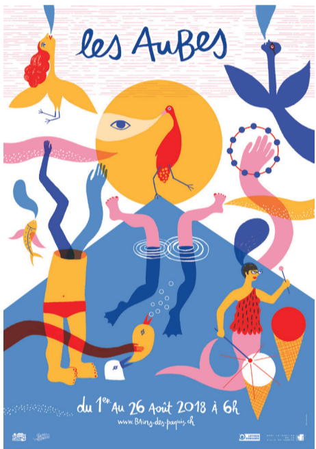
Mirjana Farkas, 2018

Des affiches comme des histoires Mirjana Farkas travaille depuis une dizaine d'années dans les champs de la littérature jeunesse, de la presse et de la communication. Elle envisage chaque nouveau projet d'affiche comme un arrêt sur image, extrait d'une narration plus ample, en mouvement.