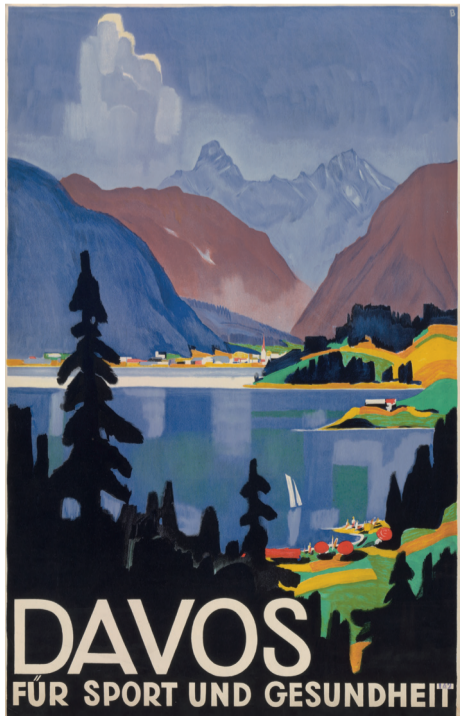
Otto Baumberger, 1932

Le « Bon Air des Alpes » dans les affiches touristiques du début du XX e siècle La mise en valeur du milieu alpin comme espace de santé accompagne au début du XX e siècle le développement des stations d'altitude. Leurs affiches touristiques témoignent de l'effort déployé pour promouvoir les éléments climatiques associés à l'idée du « Bon Air des Alpes ».