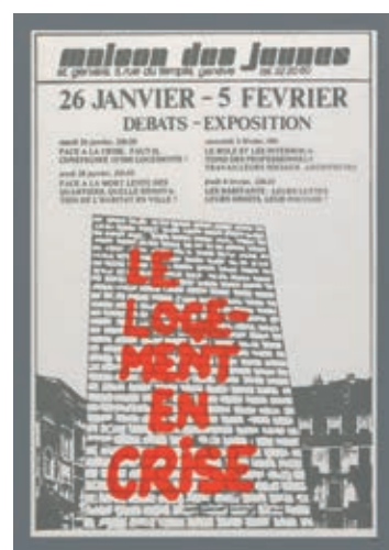
Maison des jeunes et de la culture de Saint-Gervais, 1982

Programme à découvrir en 2024 sur bge-geneve.ch