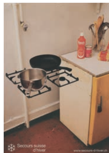
Régis Galay, 2001

Depuis le 19 e siècle et la naissance du mouvement humanitaire, l'affiche a été utilisée par les organisations caritatives comme l'un des premiers canaux de mobilisation des publics. Peu coûteuses et captant le regard dans des messages simples, elles ont servi jusqu'à nos jours à éduquer, informer, rassembler et émouvoir.