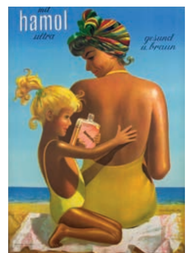
Viktor Rutz, environ 1940

Dès les années 1920, la mode du bronzage, portée par une intense publicité, révolutionne certains codes esthétiques. De nouveaux produits sont créés en matière de cosmétique, de mode vestimentaire, de tourisme ou de loisirs. Les affiches montrent comment séduire le public pour qu'il s'identifie à de nouveaux modèles sociaux, le bronzage étant souvent considéré comme un marqueur de bonne santé ou de haut niveau de vie.