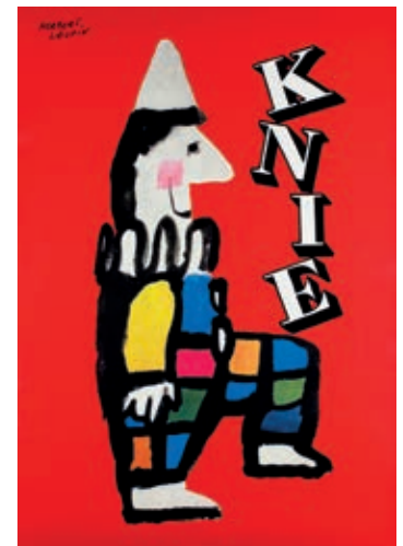
Herbert Leupin, 1956

Herbert Leupin (1916-1999) a créé tout au long de sa carrière un monde coloré, joyeux et plein d'humour où il jongle avec les styles, les concepts et les mots pour créer un langage universel. Que ce soit dans le domaine du tourisme ou de la publicité, ses affiches appartiennent à la culture populaire helvétique.