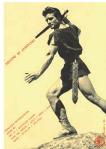
Activités culturelles, Université de Genève, 1982

En collaboration avec le Ciné-club universitaire