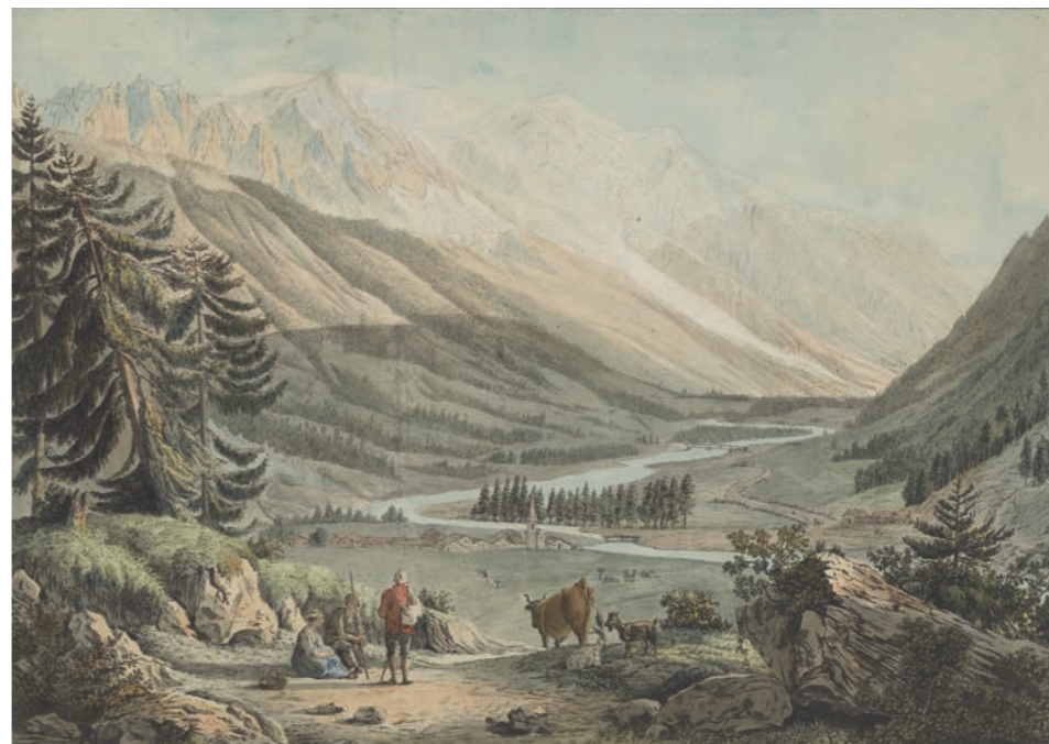
→ Jean-Antoine Linck , Vue de la vallée de Chamonix , vers 1800 [BGE CIG 37M A2 CHAM 03]