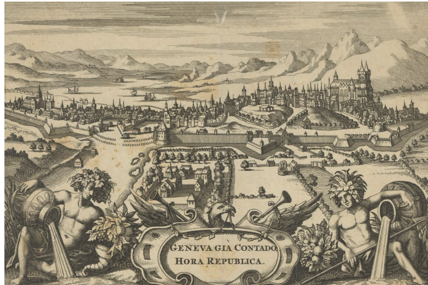
Anonyme (d'après Merian), Allégories du Rhône et de l'Arve à Genève, vers 1650 [BGE VG 0945]