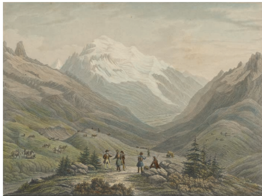
Anton Winterlin (dessin) et Theophil Beck (gravure), Le Mont Blanc vu du col de Balme , deuxième quart du XIX e siècle [BGE CIG VG 1624]