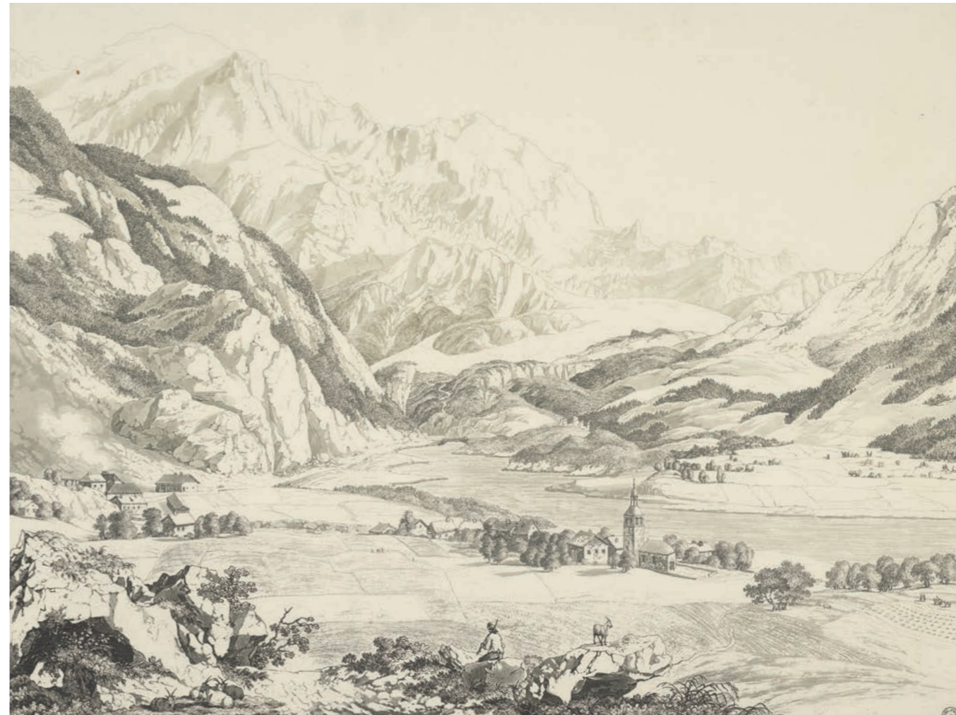
Jean-Antoine Linck, Vue de Servoz, de l'aiguille du Gouté et du glacier de Bionassay , vers 1800 [BGE CIG 37M AI SERV 01]