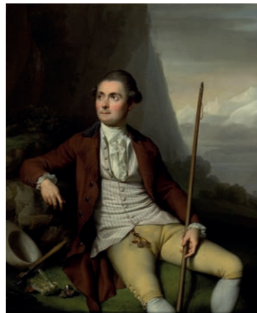
Jens Juel, Horace-Bénédict de Saussure , huile sur toile, 1778 [BGE CIG 0080]