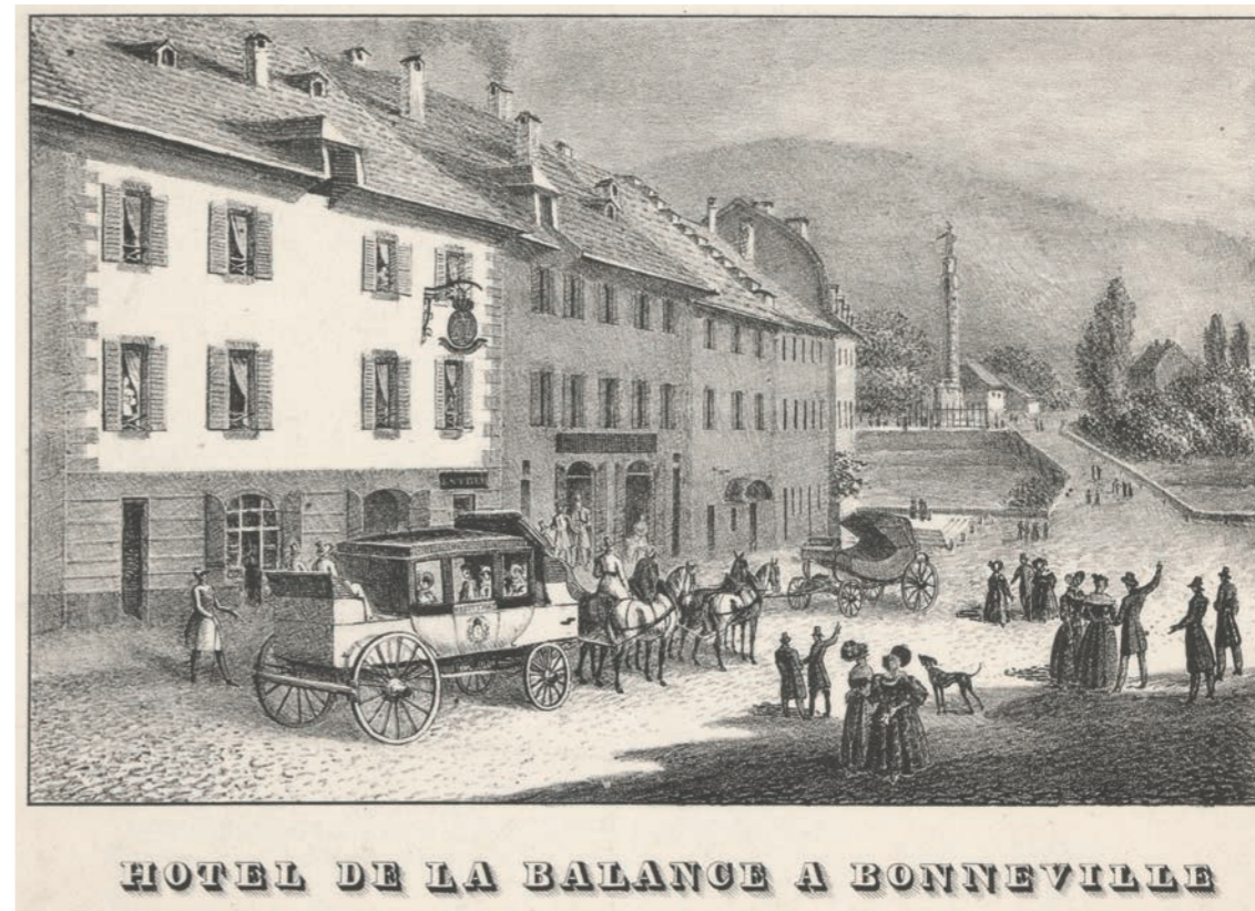
HOTEL DE LA BALANCE A BONNEVILLE

La colonne que l'on voit à l'arrière-plan a été érigée en 1826 en l'honneur du roi de Sardaigne, Charles-Félix de Savoie, qui entreprit de faire endiguer l'Arve. [BGE CIG VG 1751]