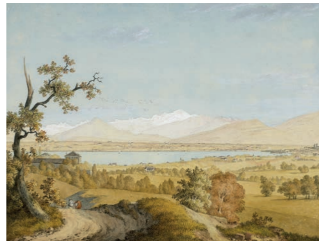
Dessinateur anonyme, Le Léman, Genève et le Mont Blanc vus de Tournay , vers 1800 [BGE CIG 01P 06]