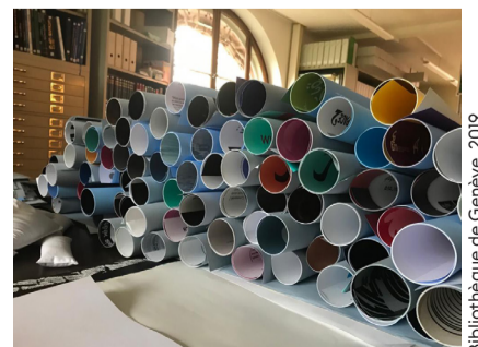
Bibliothèque de Genève, 2019

Collecter, organiser, gérer, conserver et mettre en valeur 130 000 affiches: un quotidien fait de contingences matérielles, de restauration, de dépoussiérage, mais aussi de recherches, de rencontres, de colloques et... de Jeudis midi!